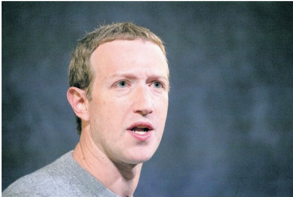
In this Oct. 25, 2019, file photo, Facebook CEO Mark Zuckerberg speaks at the Paley Center in New York.

In a broad sense, the current boycott, which will last at least a month, is like nothing Facebook has experienced before. Following weeks of protests against police violence and racial injustice, major brands have for the first time joined together to protest still-prevalent hate speech on Facebook's platforms by taking aim at the social network's $70 billion in annual ad revenue. After years of piecemeal measures to address hate, abuse and misinformation on its service, Facebook's critics hope that pinching the company where it hurts will push it toward more meaningful change. As of Wednesday, 530 companies have signed on — and that's not counting businesses like Target and Starbucks, which have paused advertising but did not formally join the "Stop Hate for Profit" campaign, which calls its action a "pause"